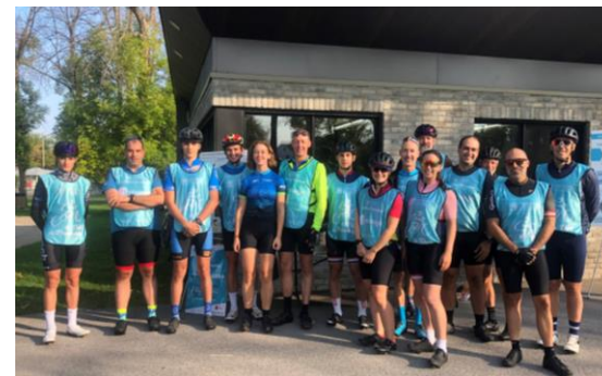
Groupe des 75 km