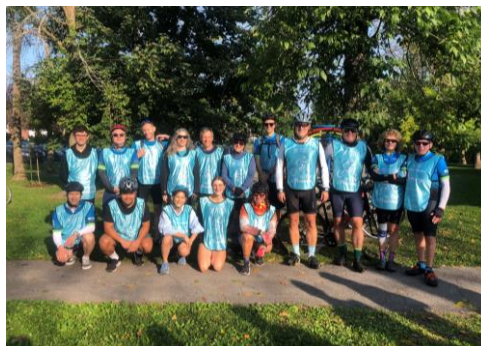
Groupe des 50 km