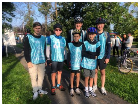
Groupe des 25 km